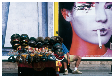
Vera Rüttimann, Schnittstelle, Fotografie